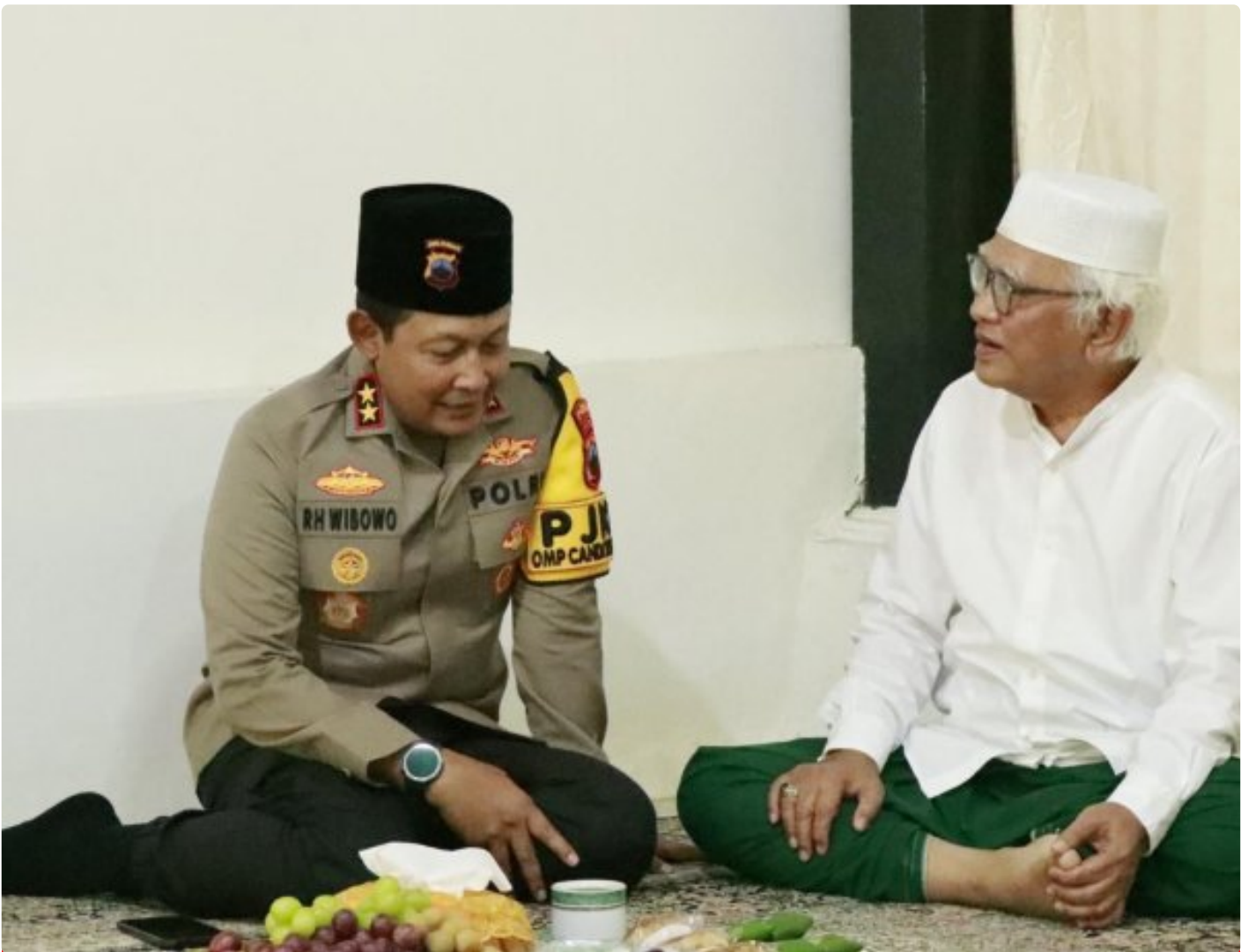
Foto: Kapolda Jawa Tengah, Irjen Pol Ribut Hari Wibowo, melakukan kunjungan silaturahmi ke sejumlah tokoh agama terkemuka di Kabupaten Rembang pada kesempatan menjelang Pilkada 2024. Senin (21/10/2024).

REMBANG- Dalam suasana hangat dan penuh kekeluargaan, Kapolda Jawa Tengah Irjen Pol Ribut Hari Wibowo mengunjungi sejumlah tokoh agama